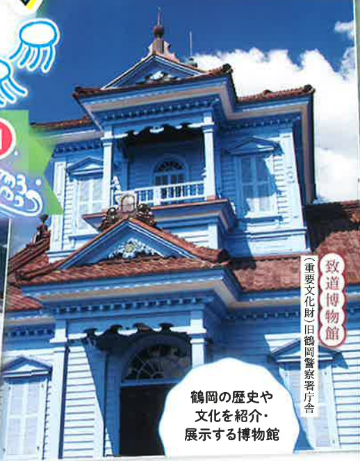
重要文化財 旧鶴岡警察署庁舎 致道博物館