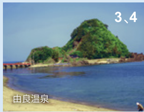
由良温泉 ☎ 0235-73-3811 (由良温泉観光協会・ホテルハ乙女)

つるおか農商工観連携総合推進協議会(鶴岡市役所 観光物産課内) ☎ 0235-25-2111(代) 【監修:山形県サイクリング協会鶴岡支部】