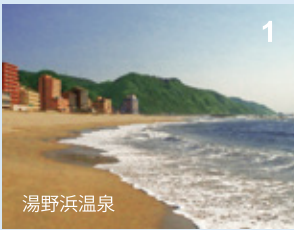
湯野浜温泉 ☎ 0235-75-2258 (湯野浜温泉観光協会) 水曜